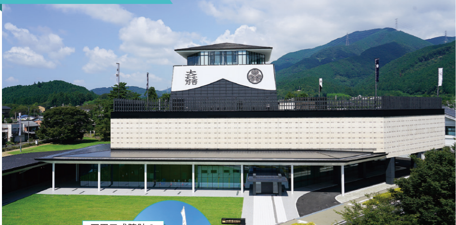
石田三成陣跡の 笹尾山が見えた!